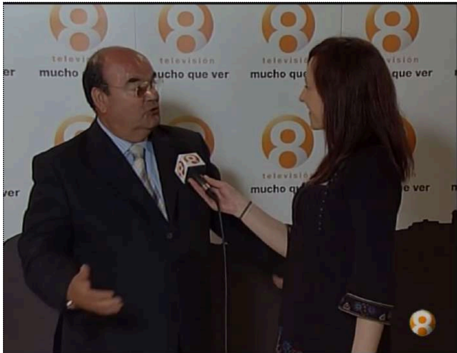
(Inauguración de emisiones de 8televisión en 2010)

El Ayuntamiento de Cuenca tiene asignado un ¼ del múltiplex local TL01CU (00), usado entre el 12 de mayo de 2010 y 8 de junio de 2011 a través del canal 8Televisión, creado durante el ejecutivo de Francisco Javier Pulido (PP) y cerrado al inicio del mandato de Juan Ávila (PSOE) con el objetivo de "ahorrar costes". Este ente tuvo unos 190.000 euros de presupuesto durante sus trece meses de existencia y empleó a 13 profesionales de nuestra ciudad. Ya de por sí, se trataba de un ente bastante económico de mantener anualmente.