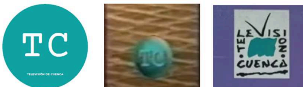
(Prototipo del logotipo de "Televisión de Cuenca" junto a los históricos de "TeleCuenca")

El prototipo del logotipo está inspirado y sirve de homenaje al extinto canal "TeleCuenca" que en los años noventa contó con un logotipo circular similar y la misma paleta de colores.