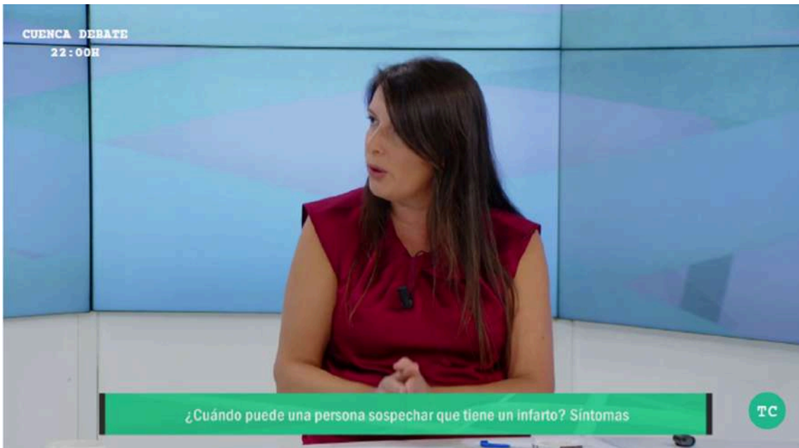
(Ejemplos de emisión con el logotipo y la publimosca de avance de programación)